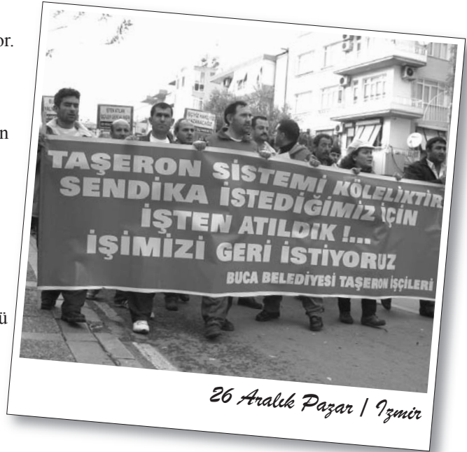
26 Aralık Pazar / İzmir