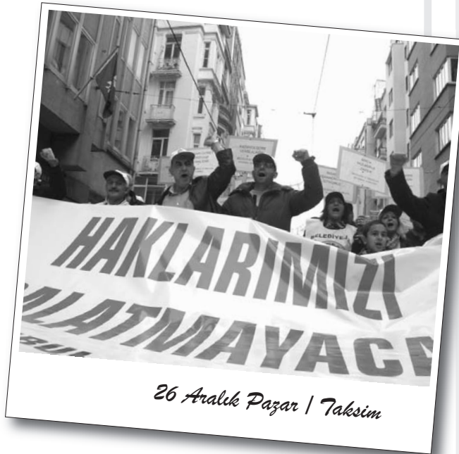
26 Aralık Pazar / Taksim

Galatasaray Meydanı'na gelindiğinde basın açıklamasını Belediye-İş 2 No'lu Şube Başkanı