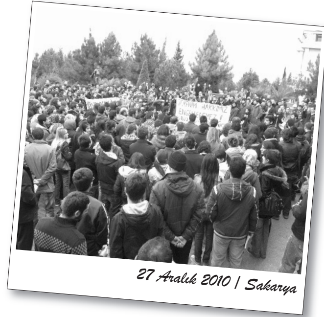
27 Aralık 2010 | Sakarya

23 Aralık Perşembe günü "Üniversiteler ve Özgürlükler" konulu panel Eğitim Sen Genel Başkanı Zübeyde Kılıç 'ın katılımıyla