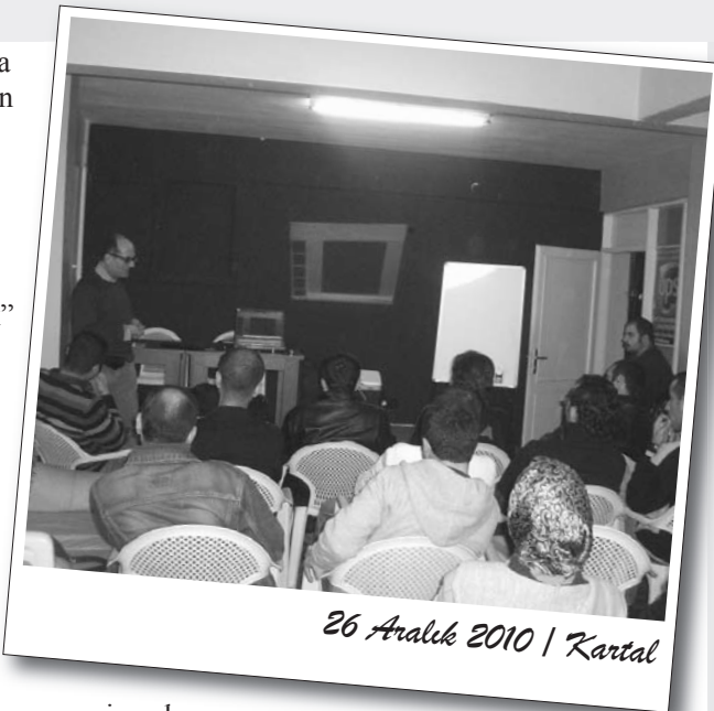
26 Aralık 2010 | Kartal

Taban örgütlenmelerine dayanan bir mücadele sürecinin belirleyici olacağını söyleyen MİB temsilcisi, Metal İşçileri Birliği'nin hedefleri üzerinden taban örgütlenmelerini oluşturmanın gerekliliğine vurgu yaptı. Sendikaları harekete